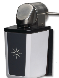
Приставка Tumbler для измерения коэффициента пропускания