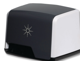
Приставка-контейнер для измерения коэффициента пропускания

Приставки для образцов к ИК-Фурье спектрофотометрам «Аджилент» Cary 630 FTIR полностью взаимозаменяемы, включаются как элемент в оптико-механическую систему.