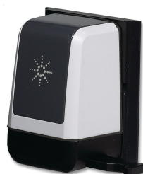
Приставка для измерения коэффициента диффузного отражения