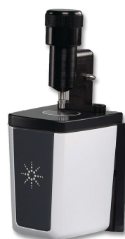
Приставка для НВО с алмазной призмой

Три простейших операции перед началом анализа: 1) убедиться в чистоте кристалла и замерить фон; 2) разместить образец на окне прибора; 3) переключить DialPath на требуемую длину оптического пути, тем самым завершая подготовку к анализу.