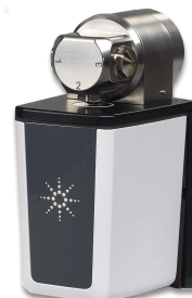
Приставка DialPath с регулируемой длиной оптического пути