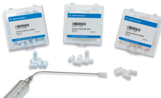
Рис. 4. Полнопоточковые фильтры