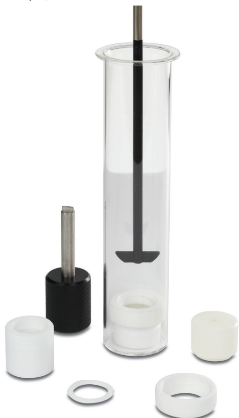
Рис. 1. Ячейка-выделитель Agilent сборной конструкции в трех размерах в зависимости от свободной площади поверхности

Оборудование может использоваться для оценки высвобождения лекарственных средств из таких полутвердых лекарственных средств, как крема, мази, гели и лосьоны. Испытания часто выполняются в процессе исследований и разработки, в рамках контроля качества и при внесении пострегистрационных изменений.