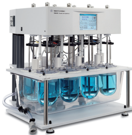
Рис. 2. Конструкция прибора для испытания растворимости Agilent 708-DS обеспечивает воспроизводимость и простоту аттестации, поэтому он является идеальной базой для стандартизации испытаний растворимости

При автоматическом отборе проб, замене среды или измерениях в режиме онлайн с помощью спектроскопии в УФ- и видимом диапазонах или жидкостной хроматографии можно выбирать среди большого диапазона средств автоматизации для шести- или восьмипозиционных систем. Если необходимо внести изменения в испытания, более независимый подход позволит найти новые пути для внедрения автоматизации. Восьмипозиционный аппарат обеспечивает простую интеграцию в режиме онлайн, поскольку запасные сосуды во время испытания используются для холостой пробы и стандарта.